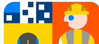
Tabla 11. Índice de la Etapa, Sistema de Cubiertas