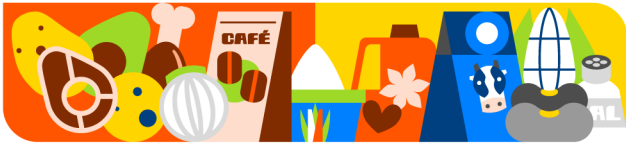
Cuadro 3 Canasta Básica Alimentaria Costo mensual per cápita por grupo alimenticio Rural* Mayo 2026