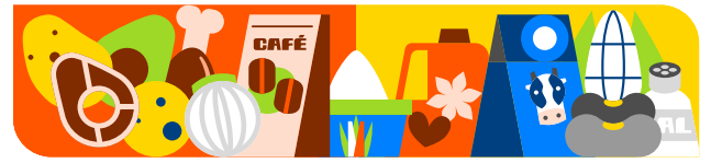
Cuadro 1 Canasta Básica Alimentaria Costo mensual per cápita por grupo alimenticio Urbana* Enero 2026