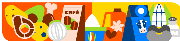
Cuadro 4 Canasta Básica Alimentaria Costo mensual per cápita por producto Rural* Enero 2026