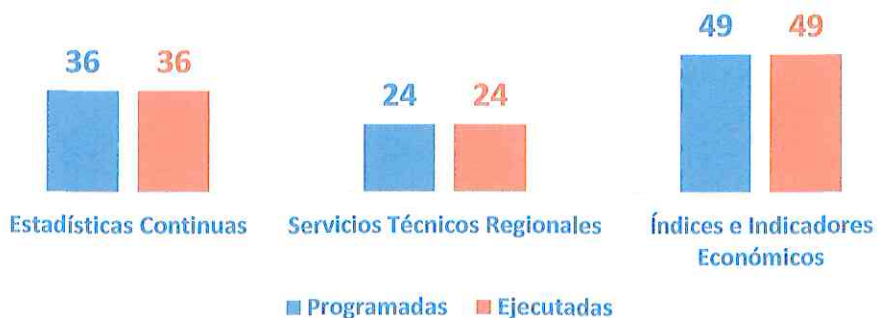
Producción de Estadística Continuas e Indicadores Metas ejecutadas Enero- Diciembre 2025