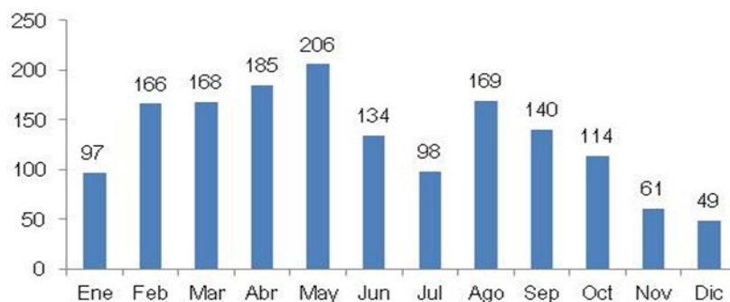
Número de usuarios por sexo Año 2013 Al último día de cada mes